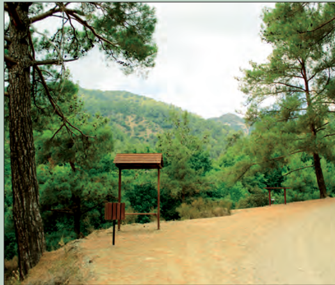
Σημείο Θέας ( View Point )