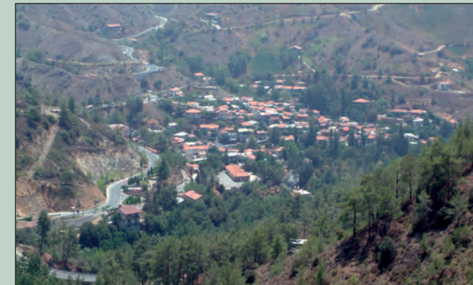
Το χωριό Φοινί ( Phini Village )

Throughout the route, dominant species of the flora is the pine ( Pinus brutia ) with understory endemic golden oak ( Quercus alnifolia ), the arbutus ( Arbutus adrachne ) and many other shrubs and herbs. In the riverbed the plane tree ( Platanus orientalis ) along with other hydrophilic plants extinct all other species.