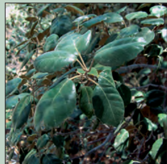
Λατζιά ( Quercus alnifolia )

Καθ' όλη τη διαδρομή κυρίαρχο είδος βλάστησης είναι η τραχεία πεύκη ( Pinus brutia ) με υπόροφο την ενδημική λατζιά ( Quercus alnifolia ), η ανδρουκλιά ( Arbutus adrachne ) και πολλούς άλλους θάμνους και πόες. Στην κοίτη του ποταμού, ο πλάτανος ( Platanus orientalis ) μαζί με άλλα υδρόφιλα φυτά εκποτίζουν τα άλλα είδη.